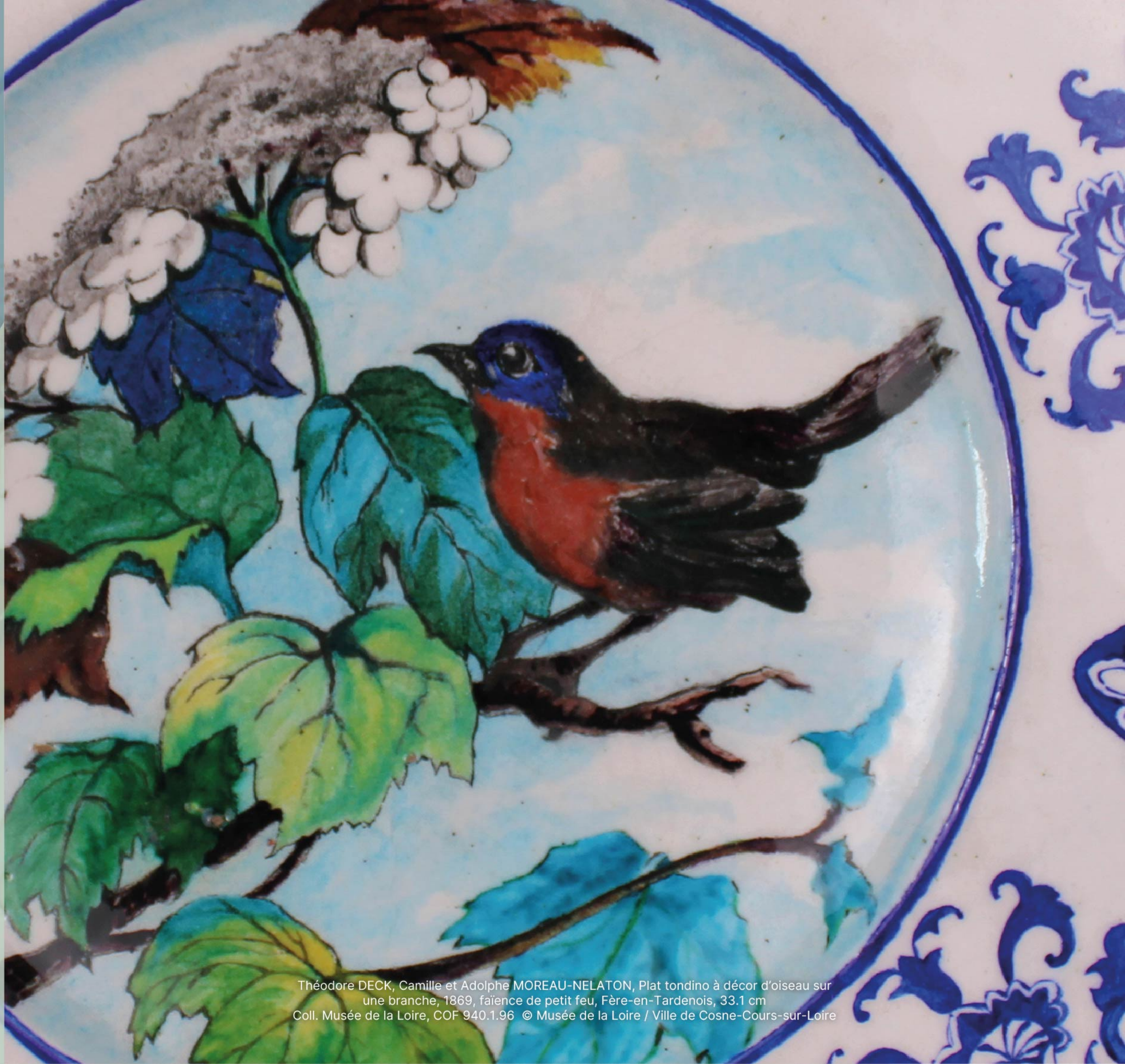
Théodore DECK, Camille et Adolphe MOREAU-NELATON, Plat tondino à décor d'oiseau sur une branche, 1869, faïence de petit feu, Fère-en-Tardenois, 33.1 cm Coll. Musée de la Loire, COF 940.1.96