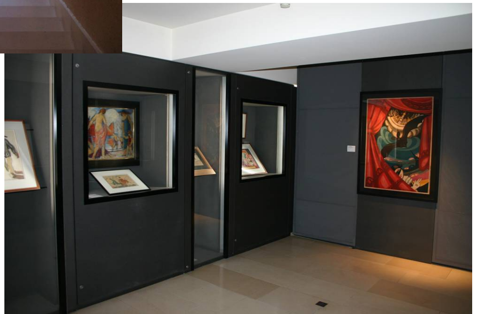
Vues intérieures des salles d'exposition et des couloirs du musée